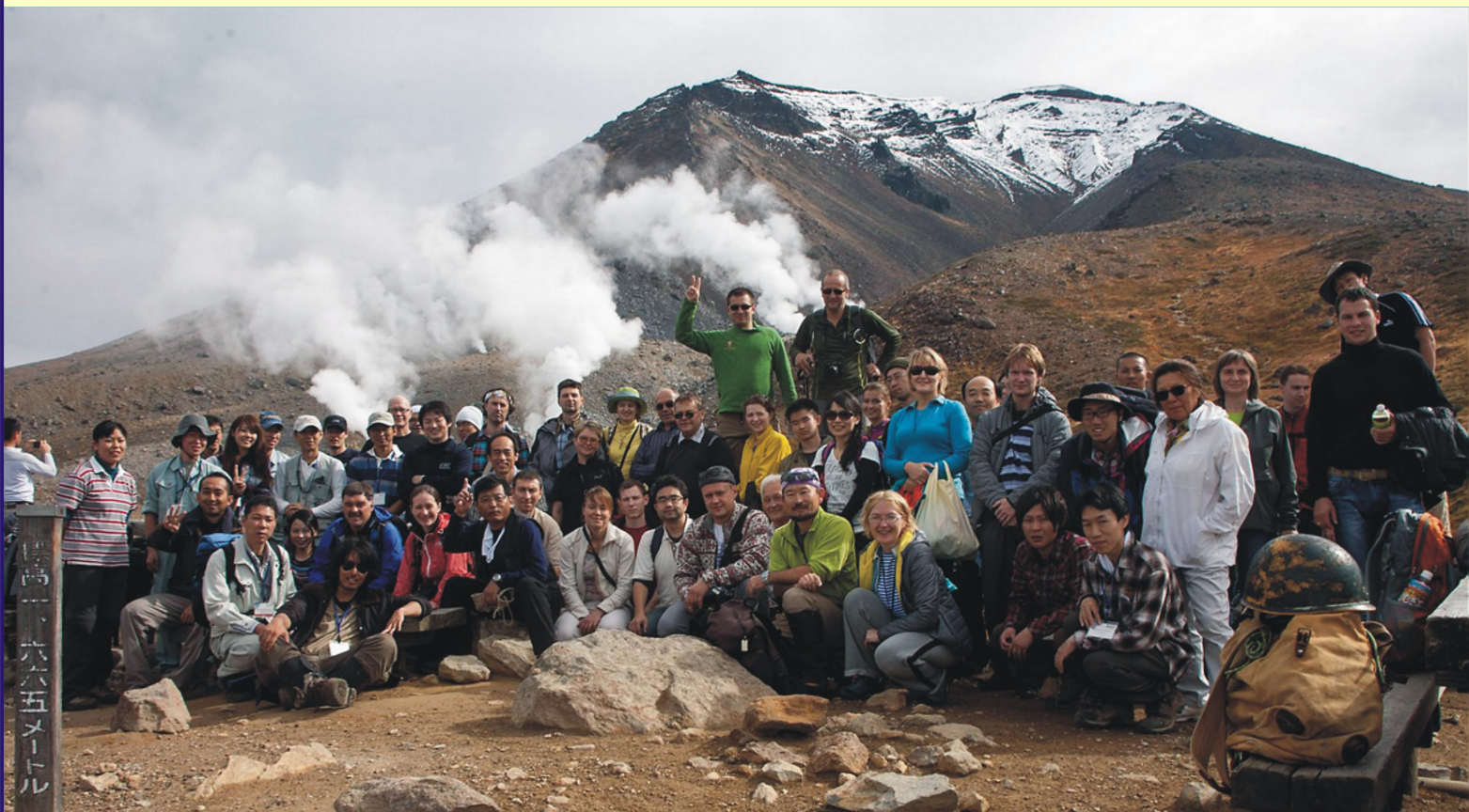
Рис. 2. Участники полевой экскурсии на фоне вулкана Асахи-даке (2290 м).