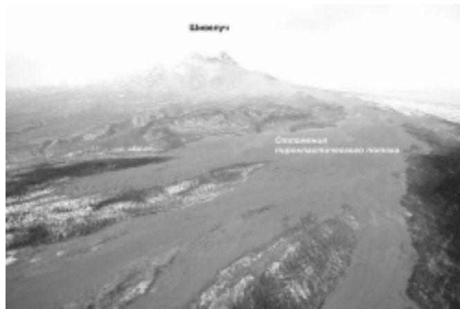
Рис. 3. Отложения пирокластического потока на склоне вулкана Шивелуч. Вид с запада-северо-запада.

Для изучения продуктов извержения вулкана Шивелуч были совершены две поездки сотрудников ИВиС ДВО РАН на буранах к центральной части пирокластического потока и к фронту одного из пяти его языков. Была измерена температура отложений пирокластике на глубинах до 1.7 м по профилю вдоль языка пирокластического потока; отобрано 30 проб