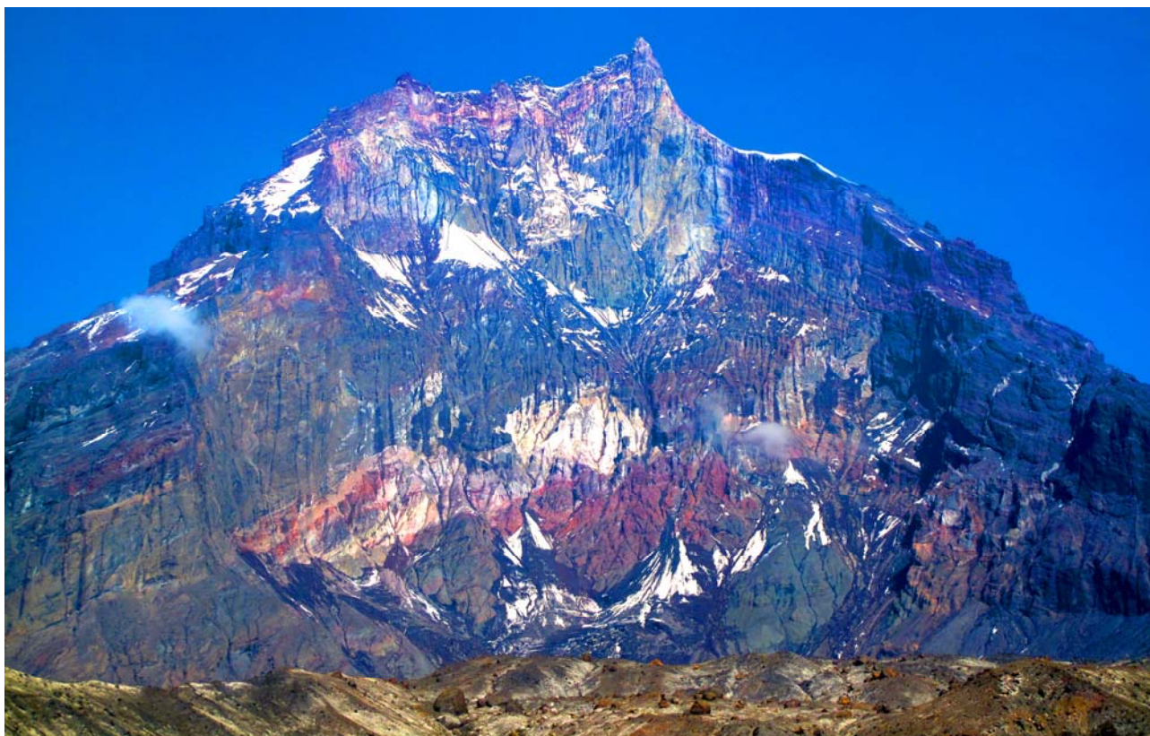
Рис. 2. Пирокластические отложения на обвальной восточной стенке вулкана Камень. Оригинальная фотография в цвете находится по адресу http://www.tachurikova.narod.ru/Churikova_2010e.pdf .

Именно такими контрастно-пестрыми отложениями пирокластики представлены и отложения обвала, произошедшего 1200 л.н. Породы Амбонской толщи представлены вулканическими брекчиями и туфобрекчиями с песчано-глинистым заполнителем. Цвет их составляет такой же спектр, что и цвет пирокластических толщ на обвальной стенке вулкана. Блоки пород Амбонской толщи могут быть представлены как чисто пирокластическим материалом, так и сложными блоками, состоящими из