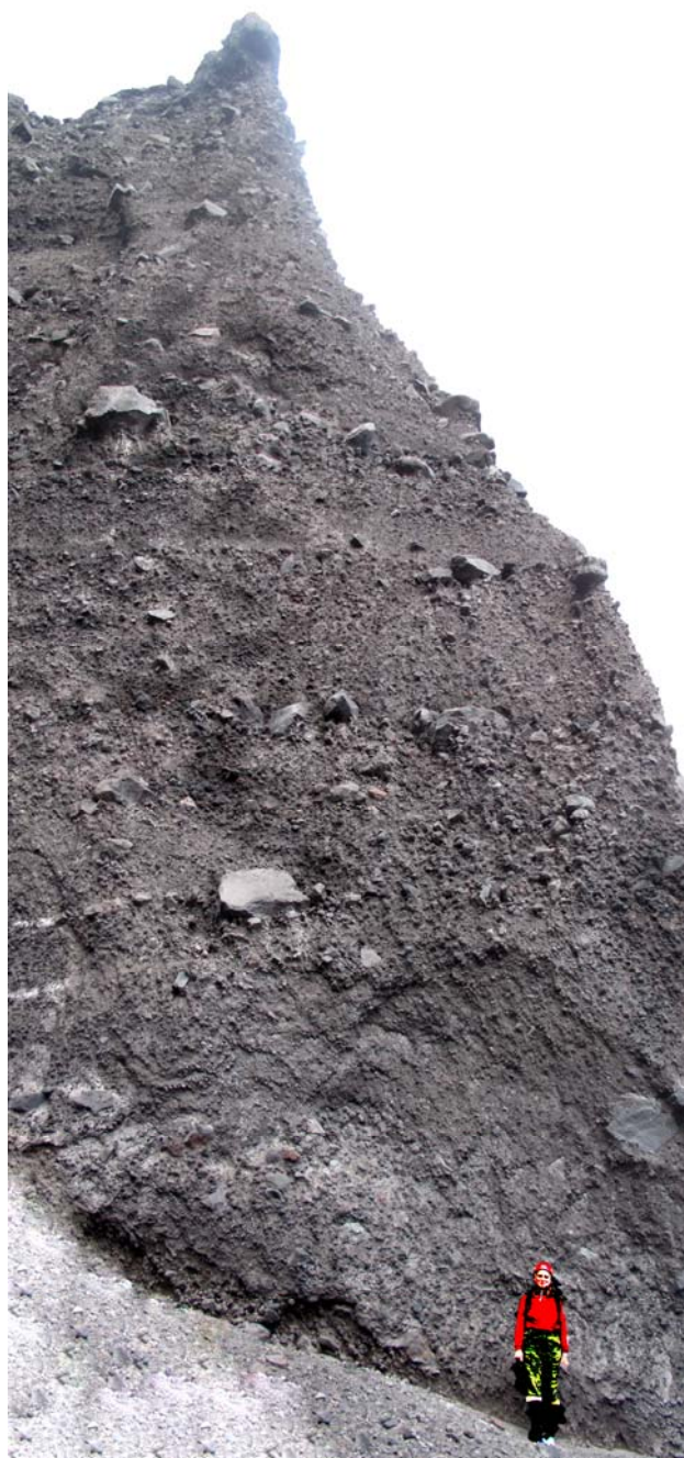
Рис. 1. Пирокластические отложения на южном борту обвальной стенки вулкана Камень.

Основная часть склонов вулкана с позднего плейстоцена по настоящее время испытала многократные обвалы, сохранился только северный сектор постройки, полностью покрытый ледником. На вулкане представлены обвалы различных масштабов – это и уже упомянутый крупнейший голоценовый обвал восточного склона объемом до 6 \text{ км}^3 , и позднеплейстоценовые обвалы типа «toreva block» – крупные части постройки, целиком съехавшие со склонов вулкана на значительные расстояния, и многочисленные разрушения меньшего масштаба [Ропотаева et al., 2006]. Обвал восточного склона вулкана Камень, произошедший 1200 л.н. [Мелекесцев, 1980; Мелекесцев, Брайцева, 1984], разрезал постройку почти пополам, вскрыл ее внутреннюю часть и