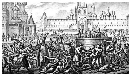
Рис. 4. Раздача хлеба голодающим в Москве.

В 1601 году весной небо омрачилось густой тьмой на весь год, а также следующий год до 27 июля из-за высотного дыма. Дожди лили в течение десяти недель непрерывно так, что жители пришли в ужас и не могли ничем заниматься. Мороз ударил 28 июля в Москве, 15 августа Москва-река замерзла, по Черному морю в Константинополь ездили на санях. Замерзли Мраморное, Адриатическое моря и северное побережье Средиземного. 1 сентября лег снег, а 10 октября замерз Днепр как зимой [4].