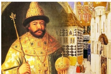
Рис. 3. Царь Борис Годунов.

В эти годы помещики давали своим крестьянам вольную, чтобы вернуть обратно по окончании тяжелых времен. Деньги потеряли цену. Цена хлеба увеличилась в 100 раз. К голоду присоединилась холера. Ситуация становилась все более нестабильной, и Годунов принял решение начать раздачу в Москве хлеба и денег из казны (рис. 4), но нуждающихся в помощи оказалось слишком много.