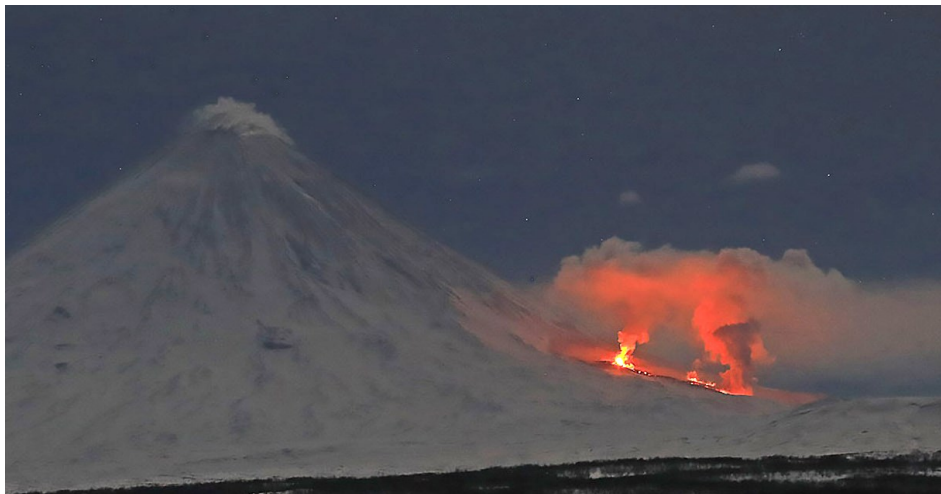
Рис. 2. Боковой прорыв на северо-западном склоне вулкана Ключевской 23 февраля 2021 г., вид с Камчатской вулканологической станции им. Ф.Ю. Левинсона-Лессинга.

17 февраля 2021 г. на северо-западном склоне вулкана на высоте 2.7-2.8 км н.у.м. произошел боковой прорыв (рис. 2), из двух центров начала изливаться лава. К 23 февраля потоки лавы достигли ледника Эрмана. По предложению А.Ю. Озерова, прорыв назван именем член-корр. АН СССР Г.С. Горшкова. Извержение продолжается. Активность вулкана остается опасной для местных авиаперевозок.