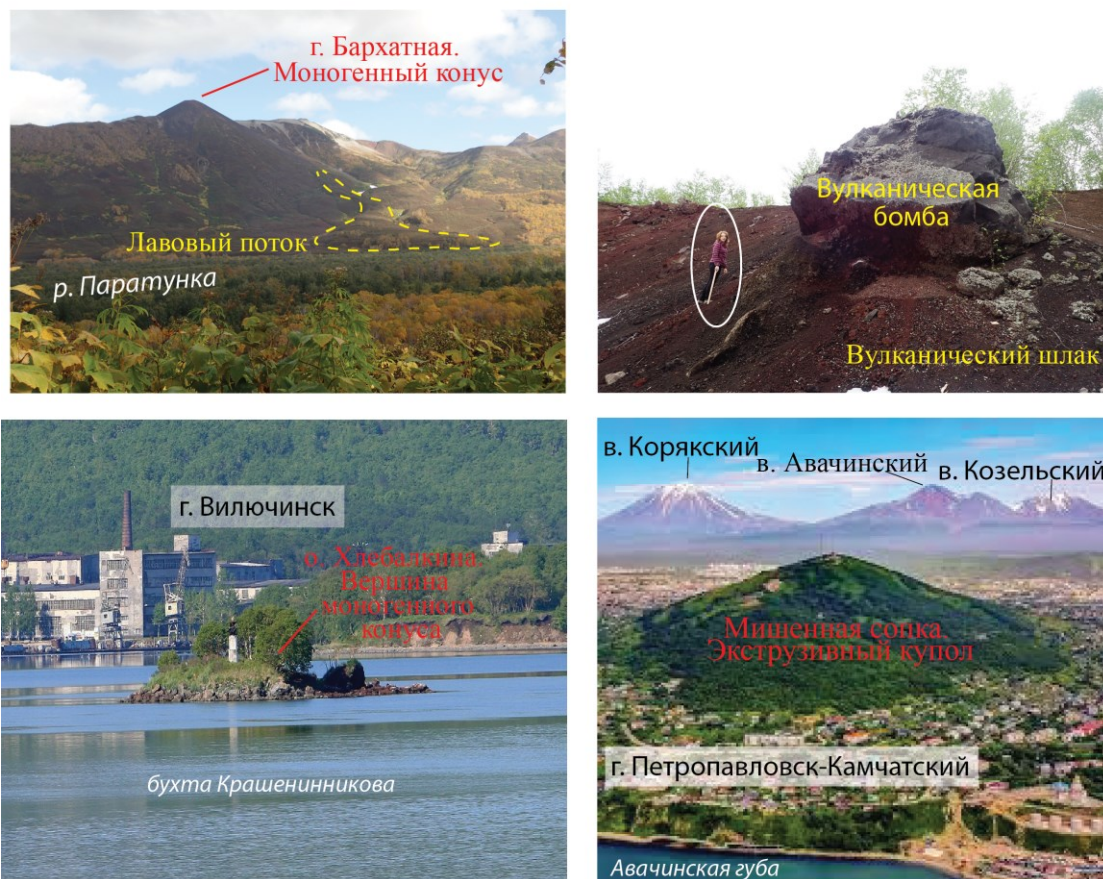
Рис. 1. Фото моногенных конусов и экструзивного купола МПЗ.

v_{8/4} = 0.20 \% . Эти вариации (прежде всего, по ^{207}\text{Pb}/^{204}\text{Pb} ) не могут быть объяснены разновозрастностью изученных магматических образований. Таким образом, они отражают первичную неоднородность магматических расплавов по изотопному составу Pb, что может свидетельствовать как о гетерогенности мантийного источника, так и о процессах контаминации мантийных расплавов на коровом уровне.