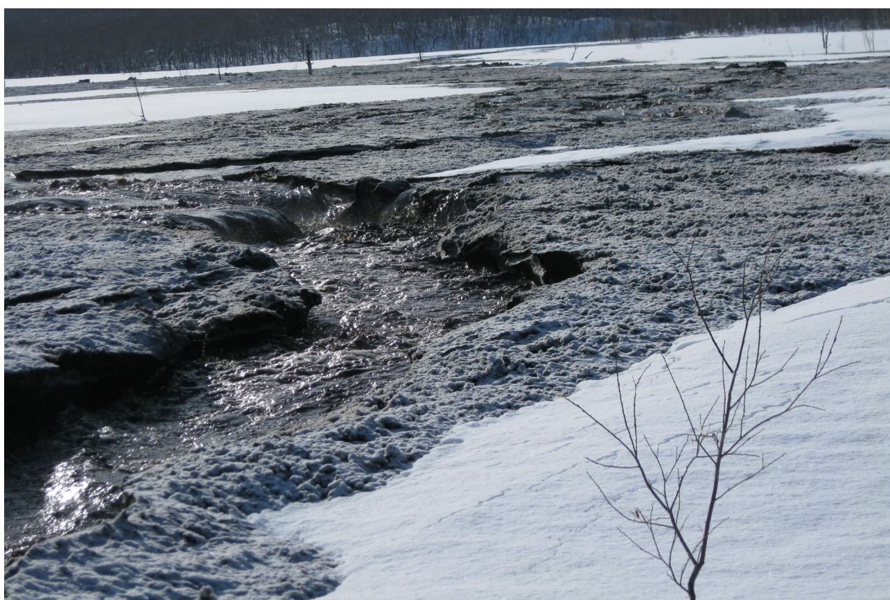
Рис. 6. Грязекаменный поток, движущийся по реке Крутенькая.