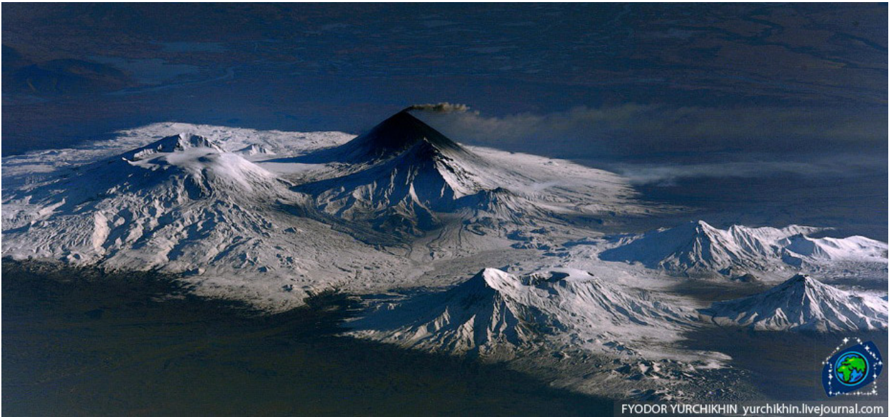
Рис. 1. Ключевская группа вулканов Камчатки. 28.09.2010 г. Пепловый шлейф протягивается от вулкана Ключевской.