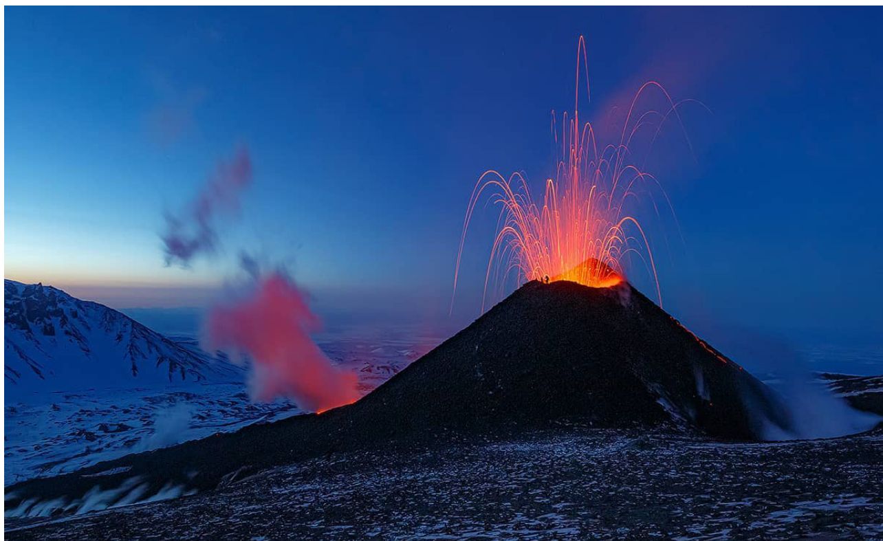
Рис. 5. Шлаковый конус прорыва Г.С. Горшкова 16 марта 2021 г.