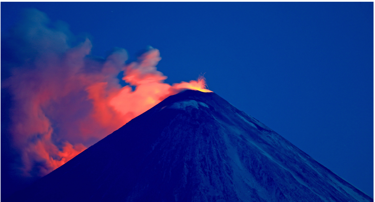
Рис. 2. Вершинное извержение вулкана Ключевской 20.04.2020 г.