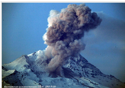
в. Шивелуч

Экскурсии планируется провести 10-11 сентября на Новые Толбачинские вулканы и 12-13 сентября на побочные извержения Ключеского вулкана (с/ст «Подкова»- прорыв Белянкина (1953) и Пийпа (1966))